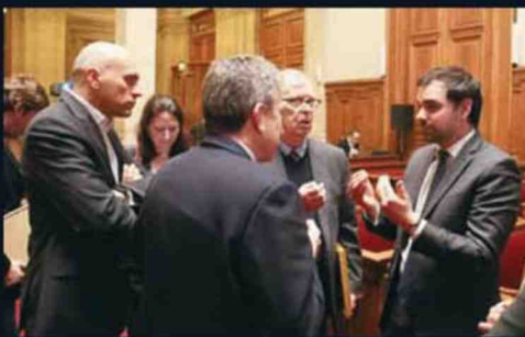
◀ Les échanges se sont prolongés avec le député Laurent Saint-Martin autour des réformes envisagées par le gouverne- ment.